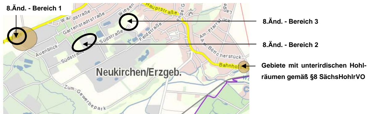
Abbildung 1: Auszug aus Hohlraumkarte

Die Hohlraumkarte weist in dem Gebiete unterirdische Hohlräume aus: 7